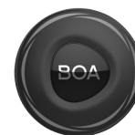
Boa Laccio TX4