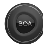
Boa Rotella L6