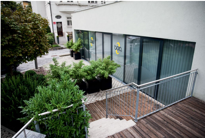
Boa® EMEA Office - Out