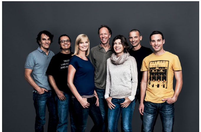
Boa® Team EMEA - 2014