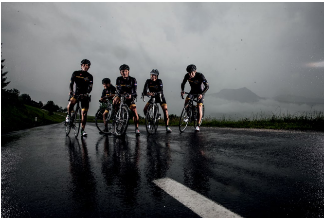
Boa® EMEA Team - Roadbike