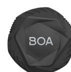
Boa Rotella L6