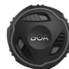
Boa Rotella M3