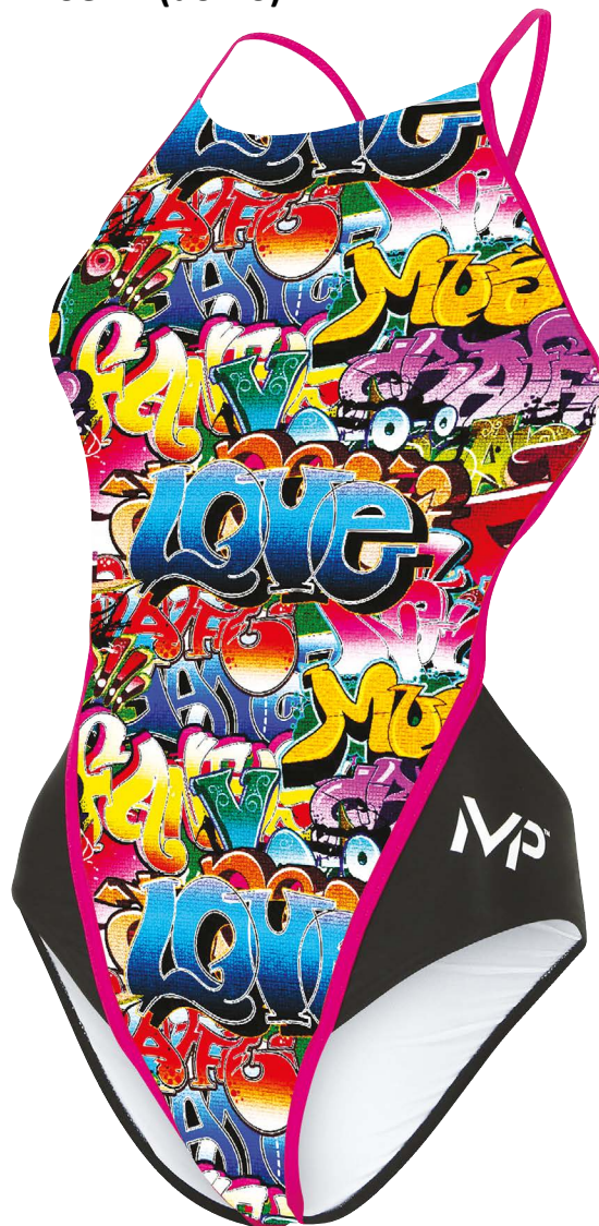
Anticipazione grafica delle stampe della collezione 2017